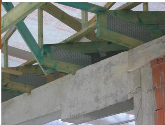
Nevhodné řešení detailu uložení vazníku - není umožněn posun, chybí hydroizolace

Z tabulky je vidět, že tyto úhelníky lze doporučit pouze pro konstrukce o menších rozpětích. Síly jsou stanoveny pro oboustranné úhelníky připojované hřebíky a vazníky tloušťky 50 mm. Hodnoty jsou orientační, pro návrh je třeba vycházet z technických podkladů firmy BOVA. Únosnost též závisí na způsobu kotvení do podkladní konstrukce.