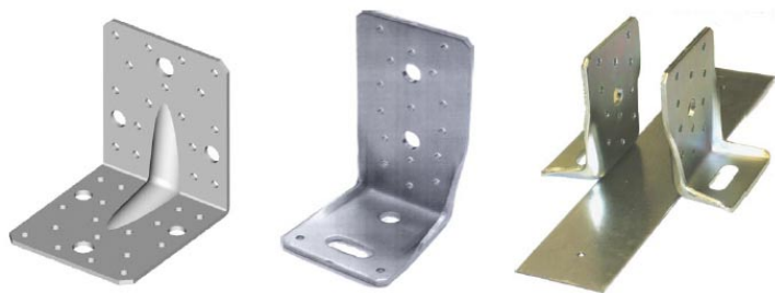
ukázka sortimentu BOVA: úhelník s výztuhou, kotvící prvek BV-KP, kluzná kotva

Máme-li zjištěny reakce od střešní konstrukce, je třeba navrhnout odpovídající spojovací prostředky, které jsou schopné tyto síly přenést a které umožní posun ve směrech, kde je třeba. Firma BOVA nabízí řadu kotevních prvků BV-KP, která kromě úhelníků různých velikostí obsahuje i kluzné kotvy umožňující vodorovný posun v podpoře.